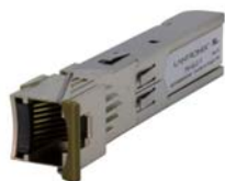
TN-GLC-T 1000Base-T モジュール

シリーズ型番中の x 表記はすべてワイルドカード文字列を示していることがあります