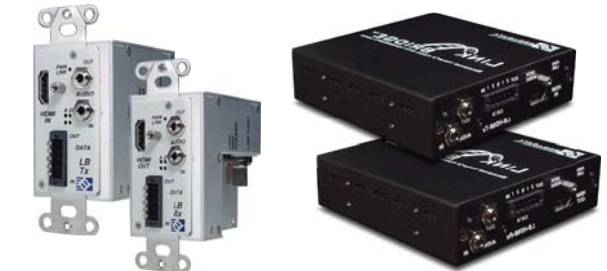
壁組み込み型 (Tx & Rx)