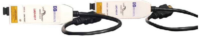
プラグابل・ケーブル付モジュール (Tx & Rx)