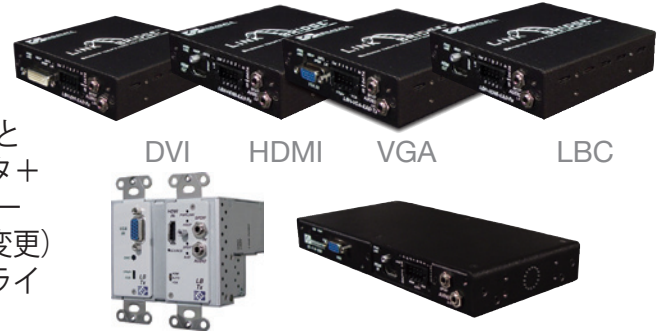
自動認識 HDMI/VGA エクステンダー