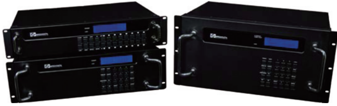
LBS モジュール型マトリックス・スイッチ